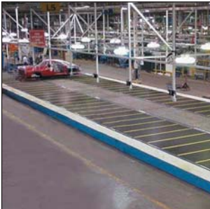
ユニCPBマンコンベア